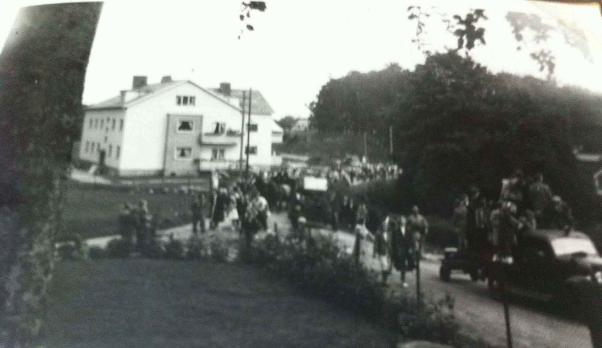
BRANDKÅREN VISAR UPP SIG, NORREGÅRDSVÄGEN